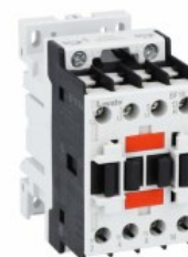
Stycznik mocy BF18